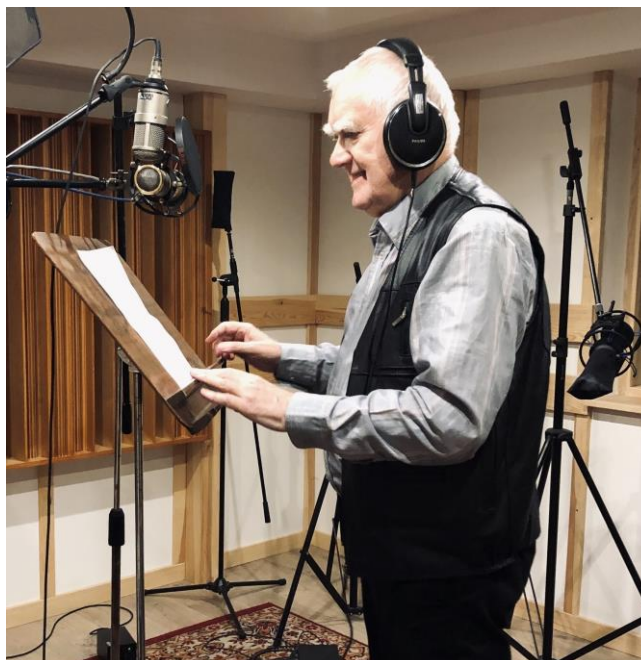
Piosenka Zakochaj się w Wesolej (tekst drukowany w numerze 6 (106) /2019, muzyka: Dawid Ludkiewicz ) znalazła się na płycie wydanej przez Ośrodek Kultury Warszawa-Wesoła